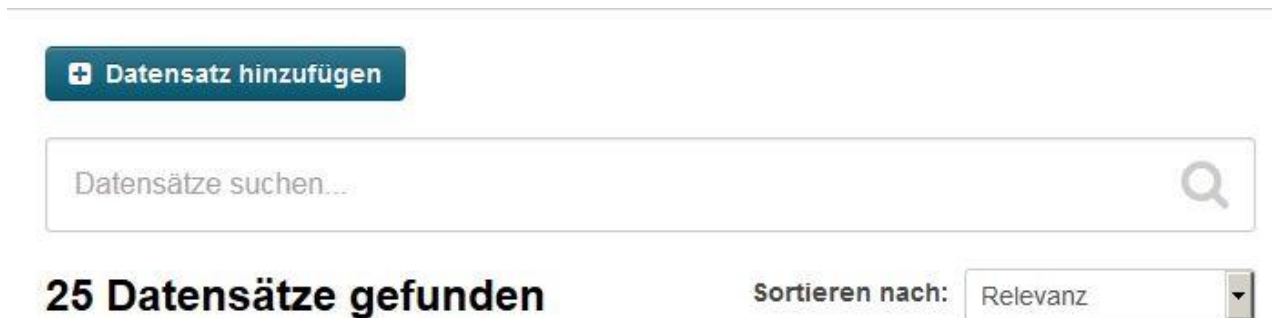
Abbildung 2: Untermenü nach Wahl der "Datensätze"-Option auf der Startseite

Durch die Auswahl eines der Menüpunkte gelangen Sie in das jeweilige Untermenü, indem Sie dann einen neuen Datensatz anlegen können.